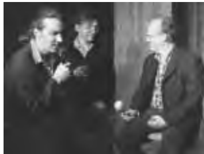
Trias Theater Ruhr: "Beautiful Losers"

Ab 20 Uhr geht's dann weiter mit einem Stück des Trias Theaters Ruhr: "Beautiful Losers" heißt die musikalische Erinnerung nicht nur für Erwachsene, in der drei Männer 40 Jahre ihres Lebens Revue passieren lassen.