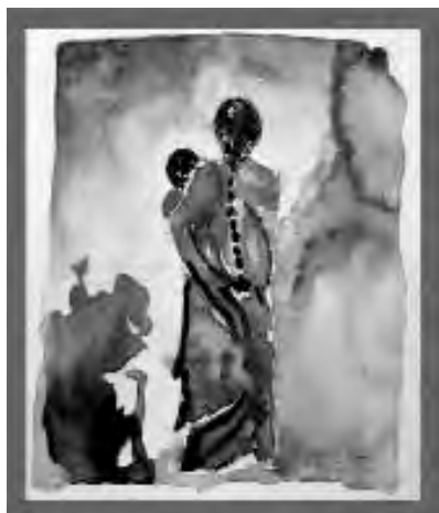
Frau mit Kind